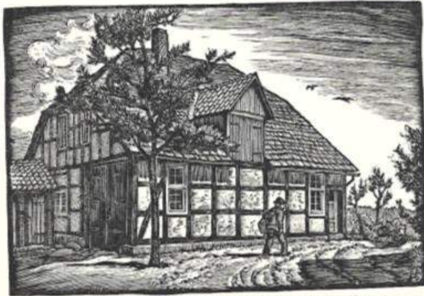
⊛ DAS PETER HILLE HAUS IN ERWITZEN / KREIS HÖXTER. ⊛