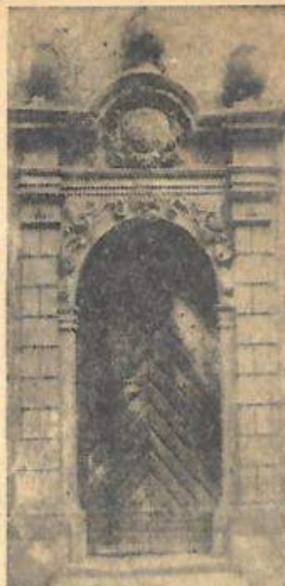
Dies ist der Haupteingang zur Pfarrkirche, die 1696/97 erbaut und dem hl. Bartholomäus geweiht wurde. Reich verziert und vom handwerklich-künstlerischen Sinn der Bauleute vor 250 Jahren kündend, steckt darin noch eindrucksvoll der Wille, in den Steinzeichen das Symbol des Eingangs zum geweihten Raum des Dorfes deutlich werden zu lassen.

Die dem hl. Apostel Bartholomäus geweihte Pfarrkirche, ein prächtiger Renaissancebau mit barocker Einrichtung, stammt aus den Jahren 1696 und 1697.